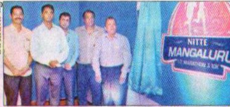
ನಿಟ್ಟೆ ಮಂಗಳೂರು ಮ್ಯಾರಥಾನ್ ಲಾಂಛನ ಬಿಡುಗಡೆಯಾಯಿತು.