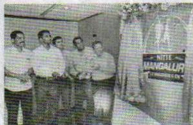
Dignitaries at the marathon logo launch